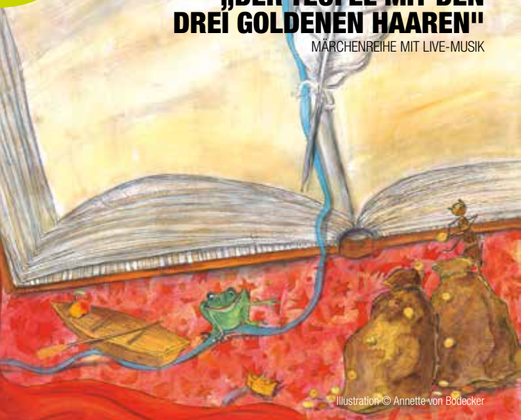
Illustration: © Annette von Bodecker